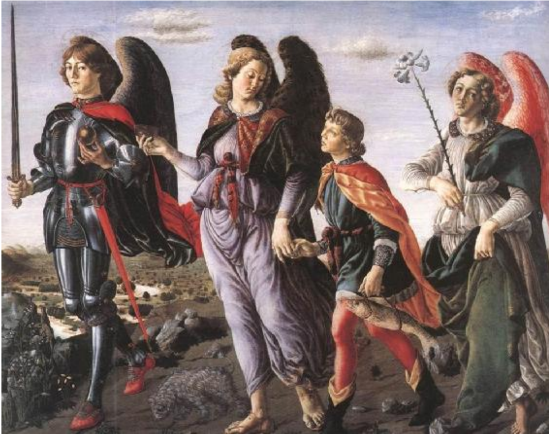
ARCHANDĚLÉ S TOBIÁŠEM

29. 9. svátek sv. Michaela, Gabriela a Rafaela, archandělů.