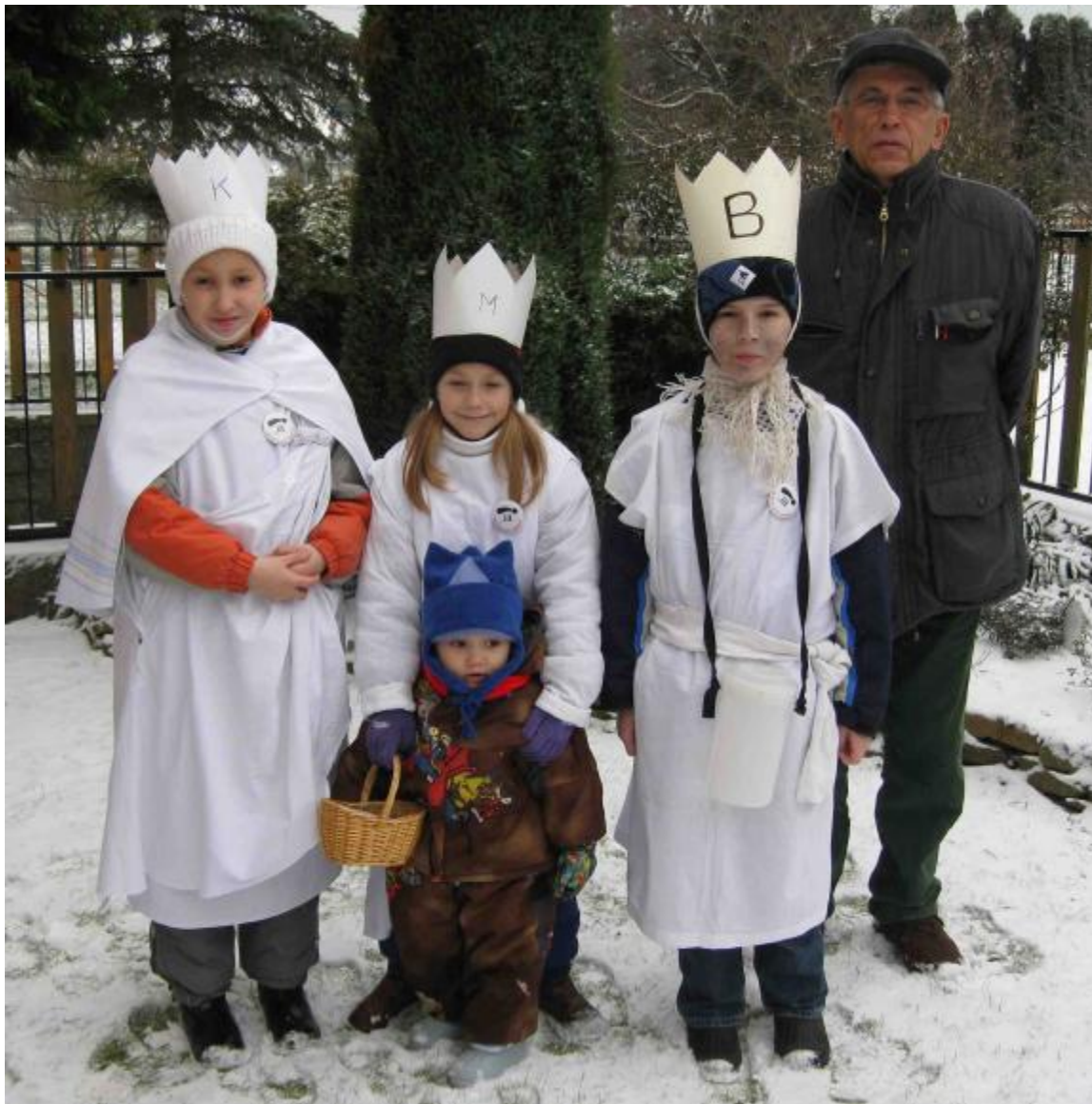
ÚPLNĚ ČESTVÉ FOTO KOLEDNÍKŮ Z ČECHTIC