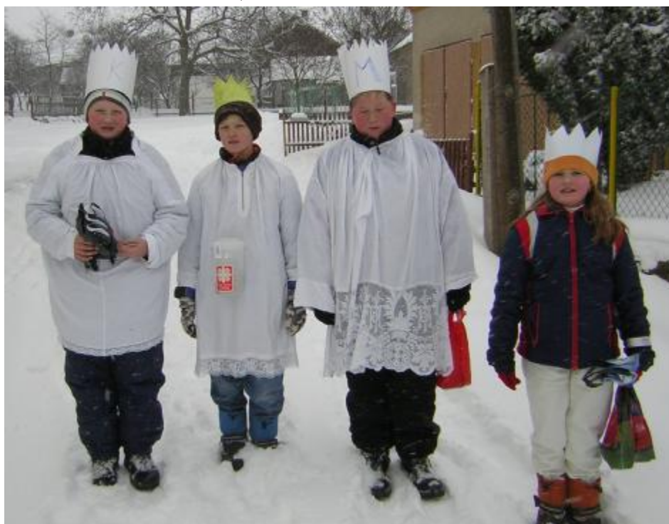
K + M + B + 2010 Kuňovice