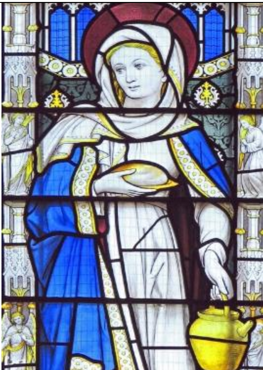
29. 7. památka sv. Marty