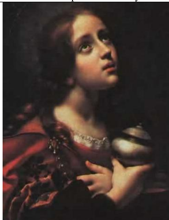
22. 7. památka sv. Marie Magdaleny