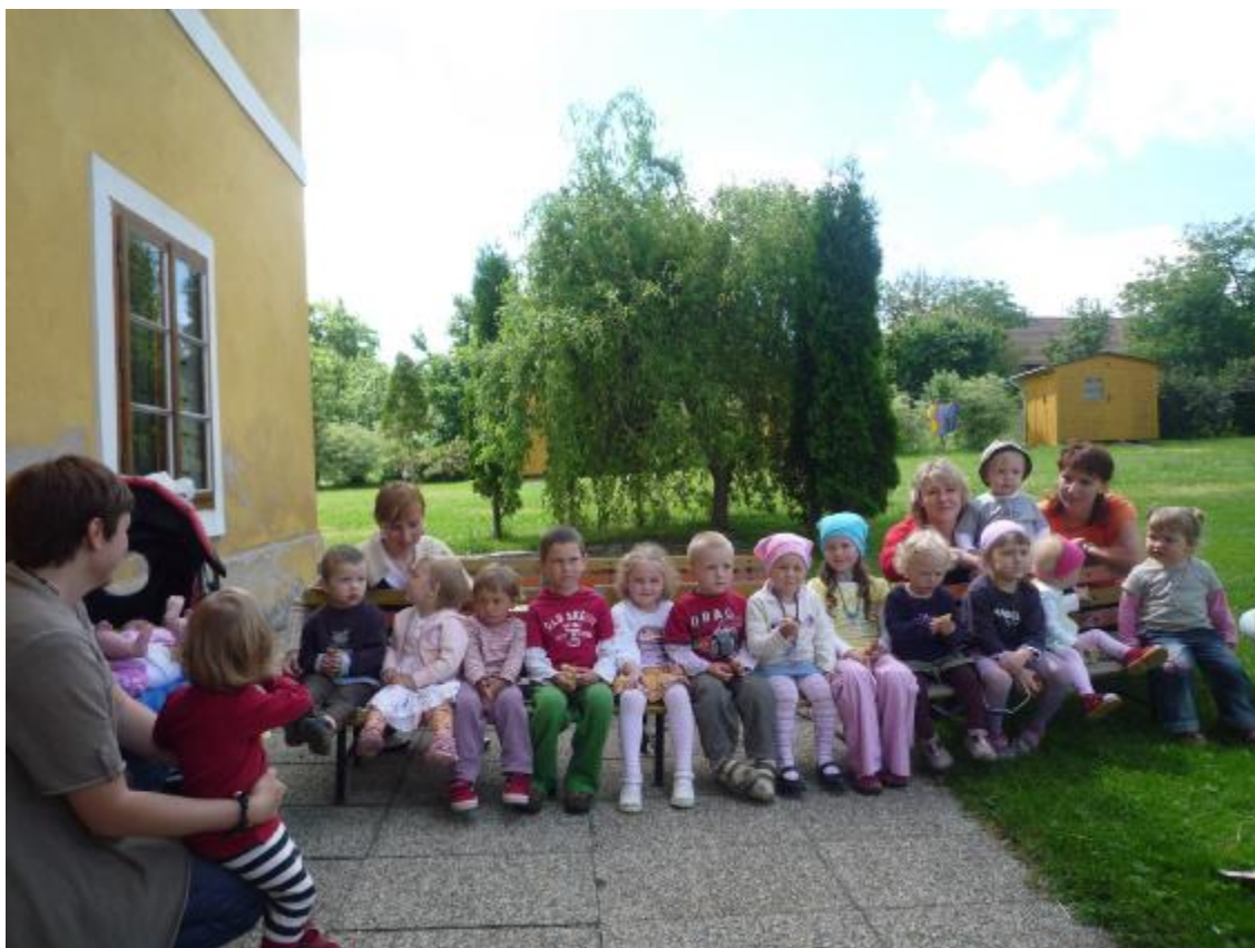
18.6.2010 - Děti sledují maňáskovou pohádku O Šípkové Růžence

Těšíme se, že se opět v září všichni sejdeme plni nápadů a inspirace pro další fungování mateřského centra. (lk)