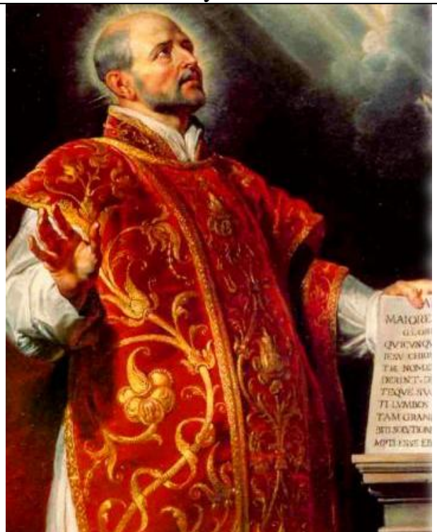
31.7. památka sv. Ignáce z Loyoly, kněze