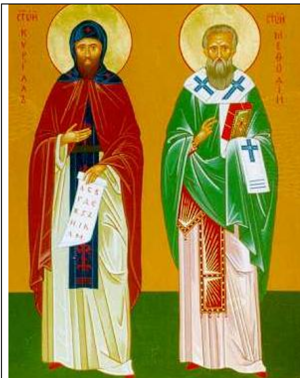
5. 7. Slavnost sv. Cyrila, mnicha a Metoděje, biskupa, patronů Evropy, hlavních patronů Moravy