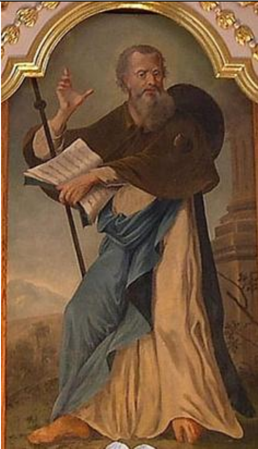
25. 7. svátek sv. Jakuba, apoštola