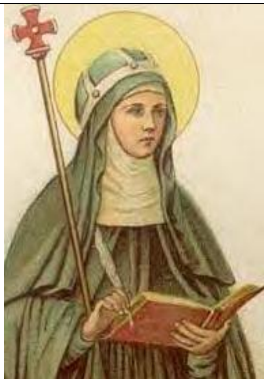
23. 7. svátek sv. Brigity, řeholnice, patronky Evropy