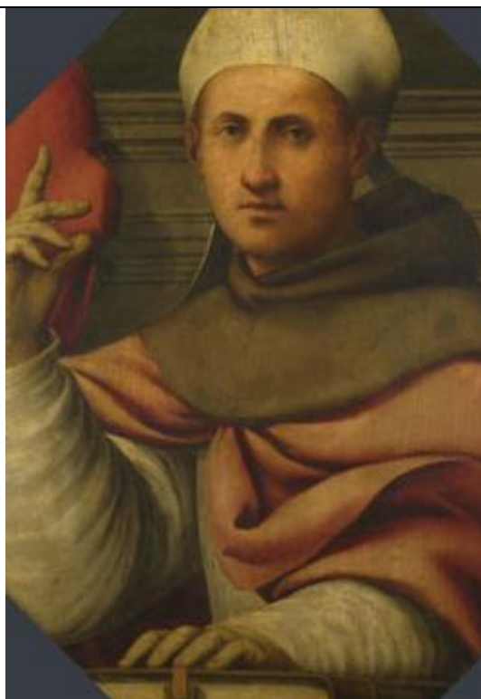
15. 7. památka sv. Bonaventury, biskupa a učitele církve